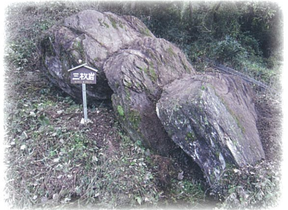
「伝説にある牛戸の三枚岩」