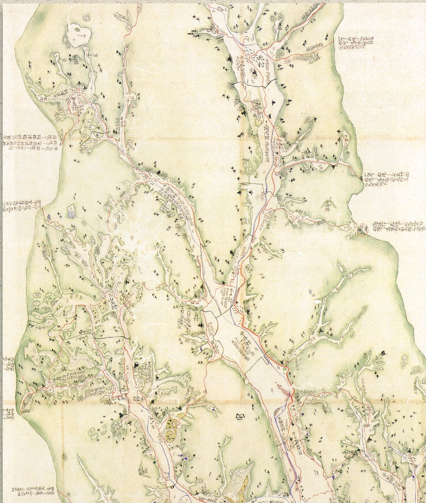
江戸時代中期 西郷の古地図