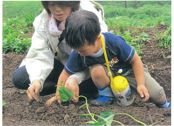
「まちむら交流・いも植え」