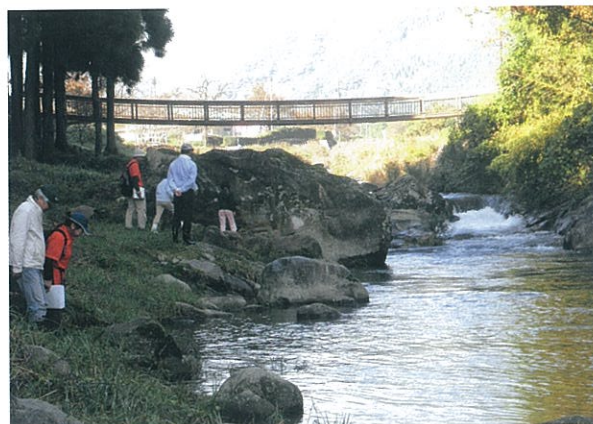
「西郷の川をよ〜く見よう」の1コマ