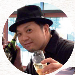
久遠チョコレート プロジェクト推進リーダー

空き家、空き店舗などの遊休不動産を改修・活用することで、まちの中に新たな産業と雇用を生み出し、生まれ変わった遊休不動産を核にまち(エリア)の価値を高めること。