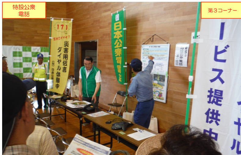
NTT西日本(株)鳥取支店による「特設公衆電話通話」の展示・説明状況