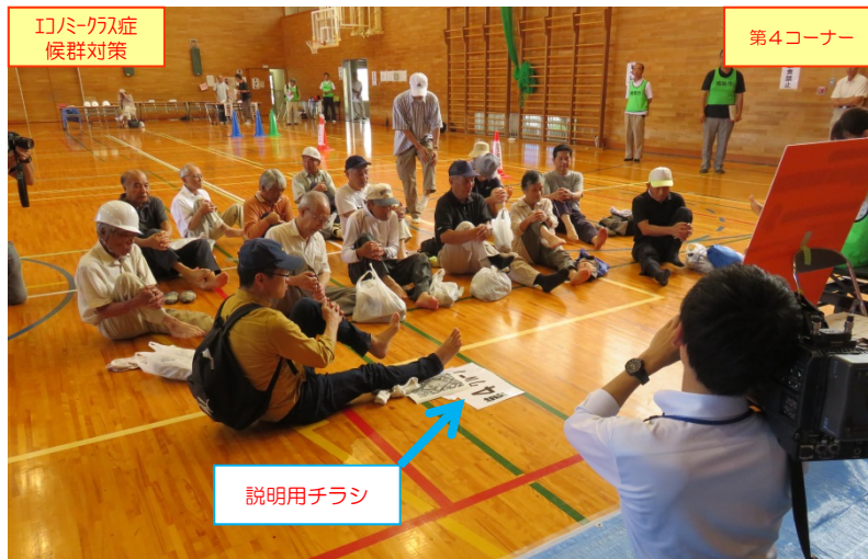
「体操指導」コーナーでのエコノミークラス症候群予防体操の体験の状況