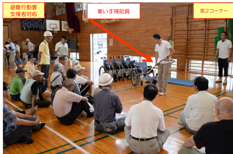
(社福)鳥取市社会福祉協議会による、車いす補助具を使用した「車いす利用者の介助要領」の展示・説明状況