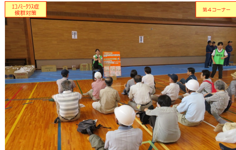
市職員(保健救護班・保健師)による「体操指導(エコノミークラス症候群予防)」の体操要領の展示