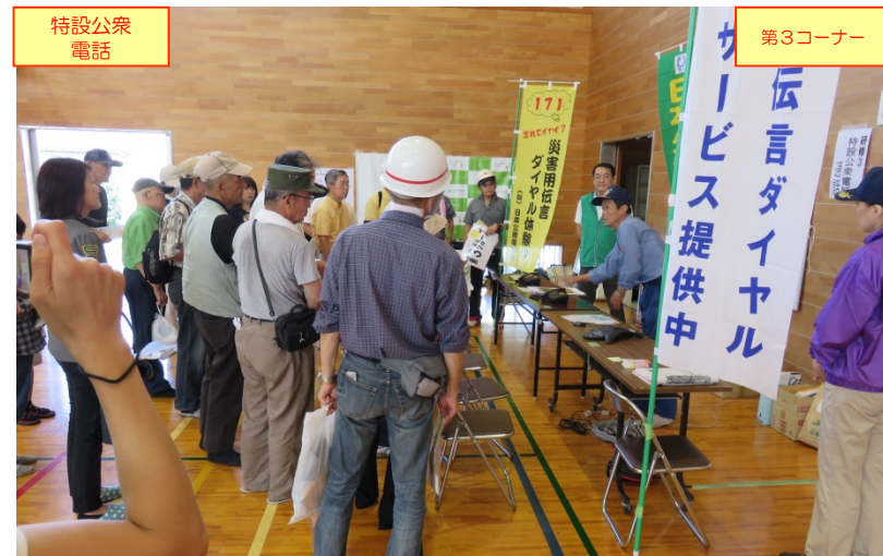
特設公衆電話を利用して被災地の方の安否情報を確認する「災害用伝言ダイヤル171」の利用法の資料を配布して、説明・展示、一部体験