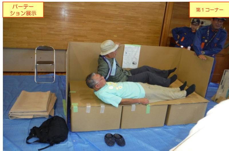
パーティション展示 第1コーナー 「パーティションの展示」コーナーでのダンボールベットの展示・説明状況