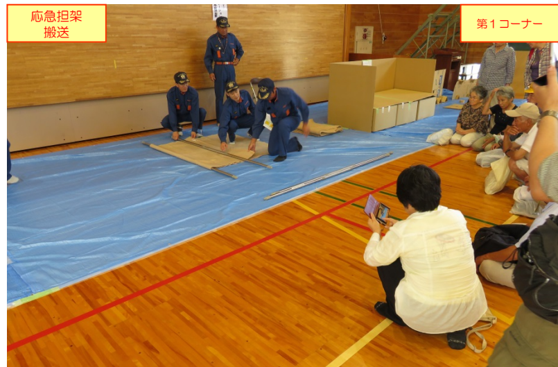
応急担架搬送 第1コーナー 鳥取市消防団中ノ郷分団員による「応急担架搬送」要領の展示・説明状況