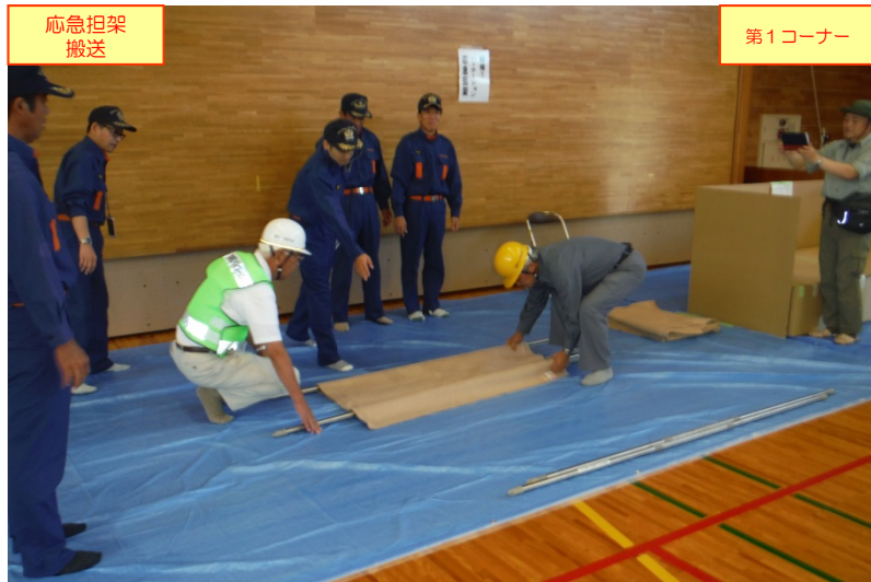
「応急担架搬送」コーナーでの応急担架作成体験の状況