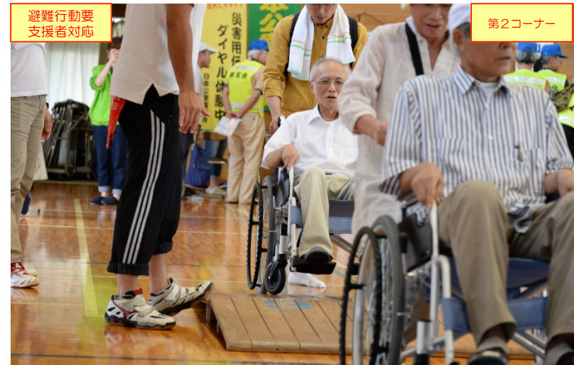
「避難行動要支援者対応」コーナーでの車いす介助体験の状況(学校の体育用具の活用：マット,踏切板)