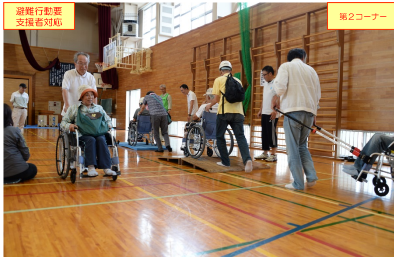
「避難行動要支援者対応」コーナーでの車いす介助体験の状況(補助具の装着,坂・段差・起伏の通過要領など)