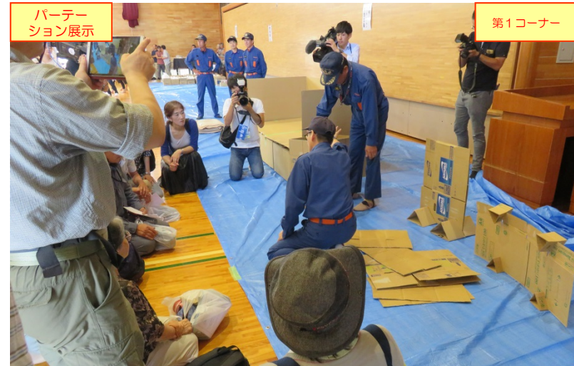
パーティション展示 第1コーナー 鳥取市消防団中ノ郷分団員による「パーティションの展示」の説明状況