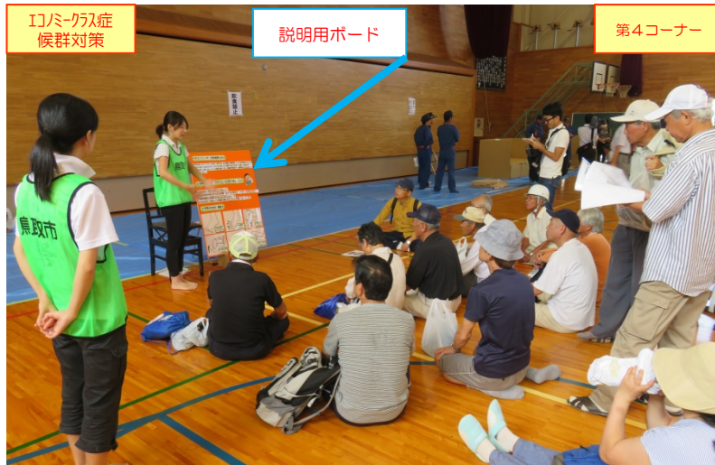
市職員(保健救護班・保健師)による「体操指導(エコノミークラス症候群予防)」の説明用ボード・チラシを使用した説明状況