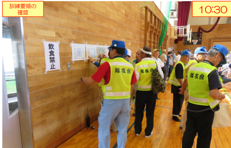
訓練要領の確認 10:30 訓練参加住民を5個グループに分けて、8カ所の体験コーナーをローテーション方式で訓練・研修する。 （体験コーナーの場所などを確認する参加者）