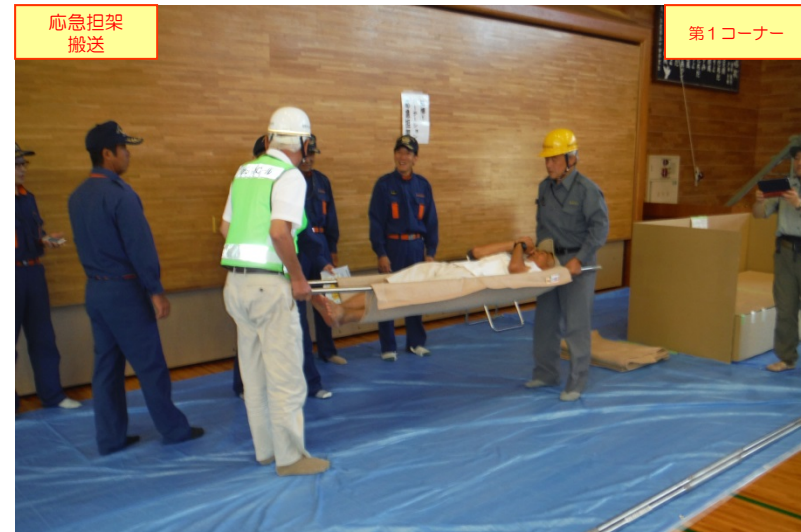
「応急担架搬送」コーナーでの応急担架搬送体験の状況