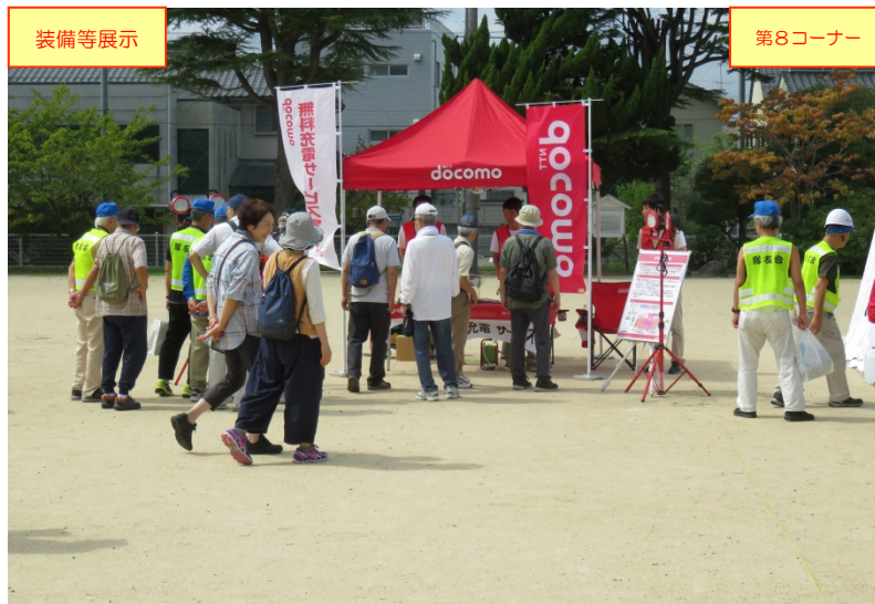
(株)ドコモCS中国鳥取支店による「装備等の展示」の状況