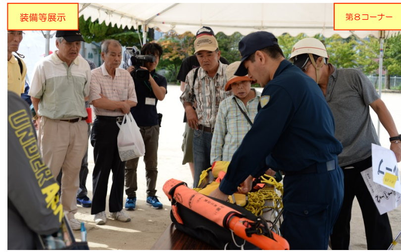
鳥取警察署員による、災害派遣時に職員等が携行する装備品の展示・説明