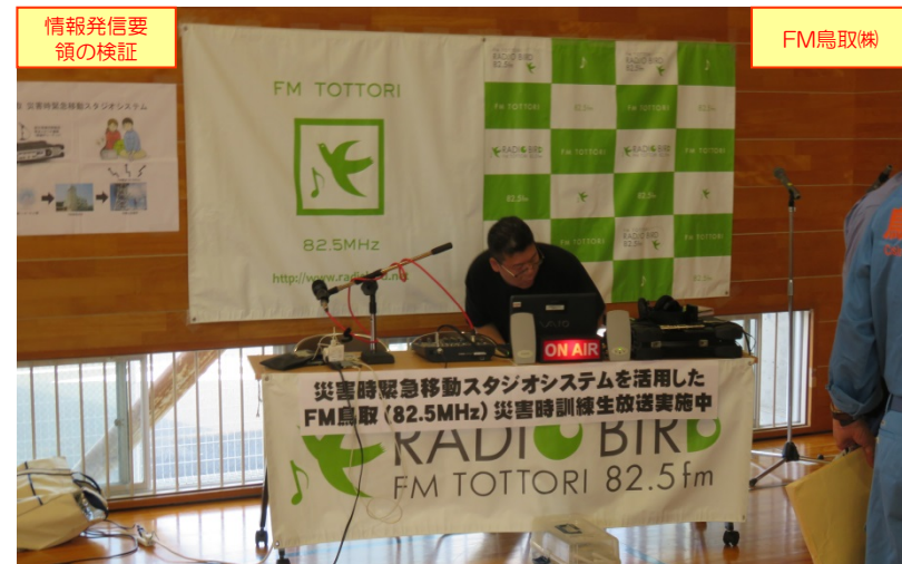
情報発信要領の検証