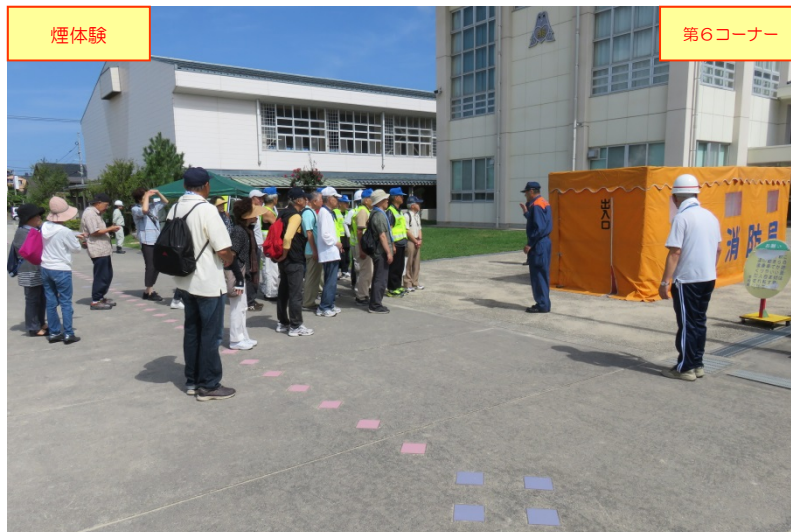
鳥取消防署員による「煙体験」要領の説明の状況 (※煙体験ハウス:鳥取消防署機材)