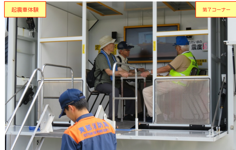
「起震車体験」コーナーでの地震の強い揺れの体験の状況