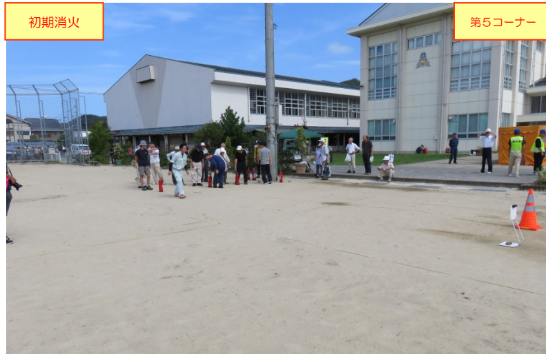
鳥取消防署員による「初期消火(消火器の取扱要領)」の説明・展示の状況 (※訓練用水消火器:松谷ホソフ(株)からリース)