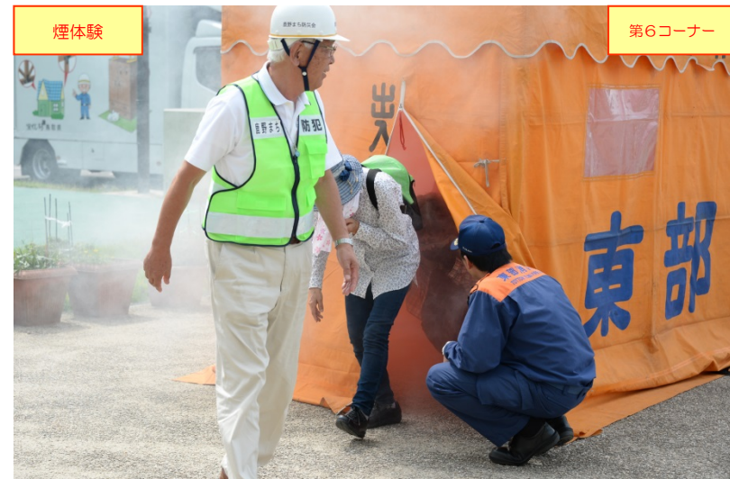
「煙体験」コーナーでの煙中(煙体験ハウス内)移動要領の体験の状況