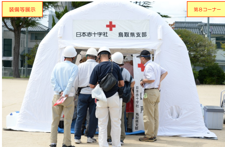
日本赤十字社鳥取県支部による「装備等の展示」の状況