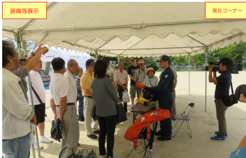
鳥取警察署による「装備等の展示」の状況