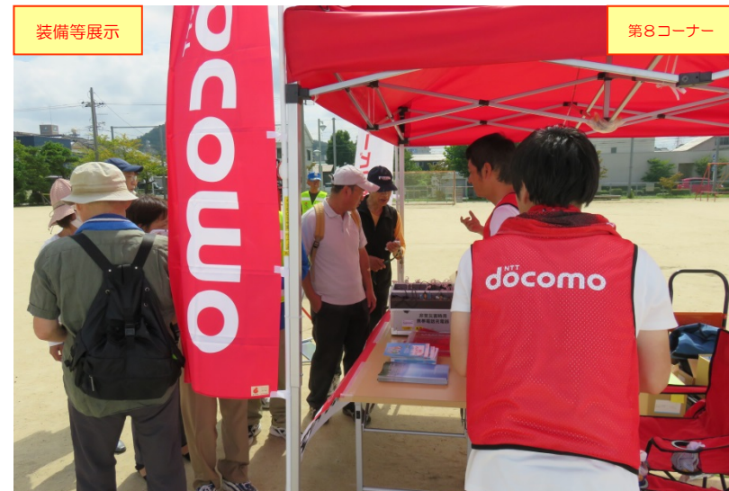
災害時用テントにおいて、衛星電話関連機材、パネル等を展示・説明