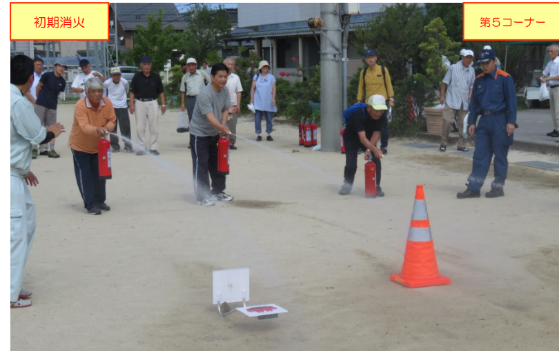
「初期消火」コーナーでの消火器を使用した初期消火の体験の状況 (※訓練補助:松谷ホソフ(株)、水再充填:鳥取消防署機材)