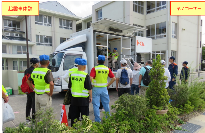
鳥取消防署員による「起震車体験」要領の説明の状況 (※起震車:鳥取県保有機材、機材操作:鳥取消防署)