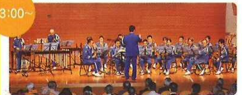
鳥取県警察音楽隊による演奏