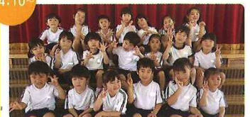
小さき花園幼稚園 園児による「防犯メッセージ」