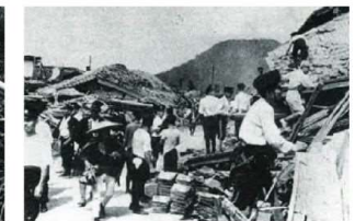
救援活動にとりかかる人々(川外大工町)