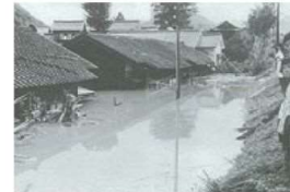
立川町二丁目付近