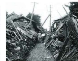
町はがれきの山に(吉方町付近)