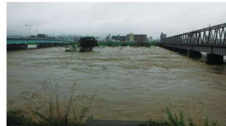
平成30年7月7日 千代川(鳥取市古海地内)

県東部を中心に記録的豪雨に見舞われ、平年の7月1ヶ月の2倍以上の降水量をわずか5日余りで更新しました。その結果、各地で家屋等の浸水被害、土砂崩れなどが発生し、約20万人に避難指示が発令されました。