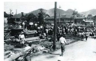
衣料品の分配に集まった被災者(智頭街道)

鳥取県東部地域はマグニチュード7.2(震度6)の地震に見舞われました。この地震による被害は、死者・行方不明者1,210人、全壊・半壊家屋14,065棟にも及びました。