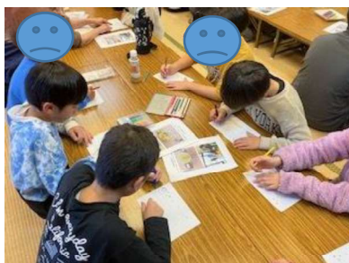
お手紙を書く様子